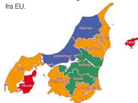
Grøn: Gruppe med højeste indekstal Blå: Gruppe med næsthøjeste indekstal Gul: Gruppe med næstlaveste indekstal Rød: Gruppe med laveste indekstal

Den slags diskutabile statistiske rangeringer fremkalder dårlige minder hos mange i Hjørring, der har arbejdet med erhvervsudvikling, og som husker, hvordan den gamle Hjørring Kommune i modsætning til nabokommunerne på grund af en statistisk detalje i en årrække var udelukket fra at søge Mål 2-midler fra EU.